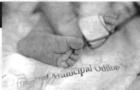
Partos chegam a ser recusados, pois crianças que poderiam receber alta ocupam vagas

“Mesmo com alta médica, a espera por uma vaga em abrigo é regra,