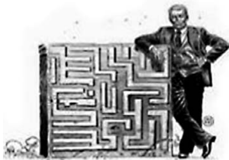
Figura 1. Labirinto

Em sua tese, Da Cruz (2016, p. 83) conta que abriu mão de um agir técnico mais prescritivo na condução da pesquisa e que se dedicou ao movimento de encontro com as coisas, com as pessoas, com as cenas, com as imagens, com os corpos de todas as ordens, das naturezas mais variadas , buscando novas formas de expressar-se. Nesse movimento, usou a imagem/significado do labirinto pra entender como funcionava o epistemológico nela e falar da sua transformação como pesquisadora ao longo da experiência da sua tese. Vamos aproveitar as imagens/significados que Da Cruz (2016) criou do labirinto para falar do quanto olhamos para os processos que vivemos do lado de fora. Na figura 1 (DA CRUZ, 2016, p. 83) vemos um labirinto e ao seu lado a imagem de um executivo, que tinha uma expressão de segurança e felicidade, e dava a impressão de que ele dominava os segredos do labirinto.