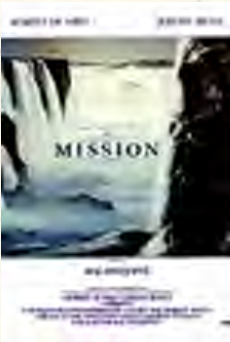
A missão (Roland Joffée, 1986)