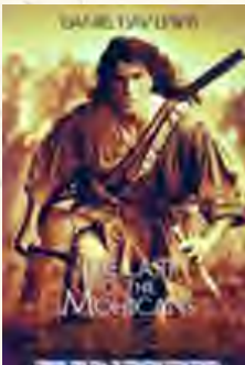
O último dos moicanos (Michel Mann, 1992)