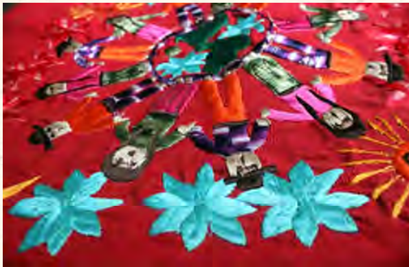
Povos do mundo. Detalhe de um bordado do povo maia.

Paremos só um minuto para pensar de onde vieram nossas famílias e qual o caminho percorrido para chegar no Brasil.