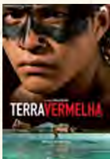
Terra vermelha (Marco Bechis, 2008)