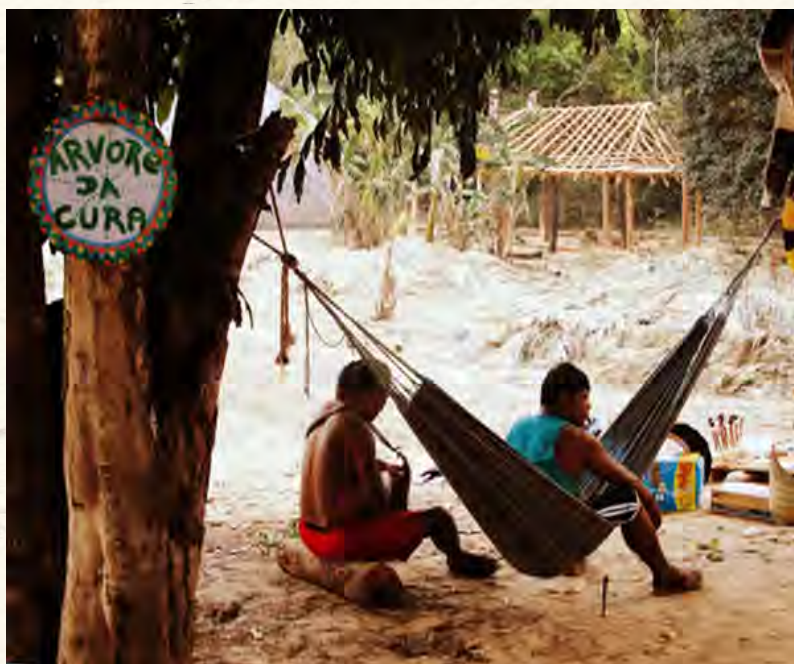
A árvore de cura (Foto: Vatsi Danilevicz).