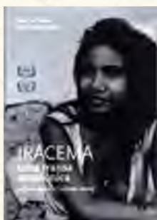
Iracema - uma transa amazônica (Jorge Bodanzky e Orlando Senna, 1974)