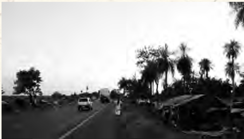
Luta de Guarani-Kaiowás por sobrevivência na beira de estradas (Foto: Rosa Gauditano/ StudioR).

Quando chove, a lama escorre dentro das barracas e eles precisam colocar pedras ou tijolos para pisarem, caso contrário os pés ficam enterrados na lama. Também precisam colocar os móveis e utensílios sobre pedras para não molhar as roupas. Felizmente tem o rio perto, onde eles tomam banho e se refrescam e as crianças, que mesmo com tão pouco, ficam felizes.