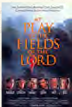
Brincando nos campos do Senhor (Hector Babenco, 1991)