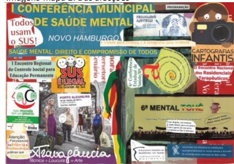
Imagens-mapa 2: Das afecções