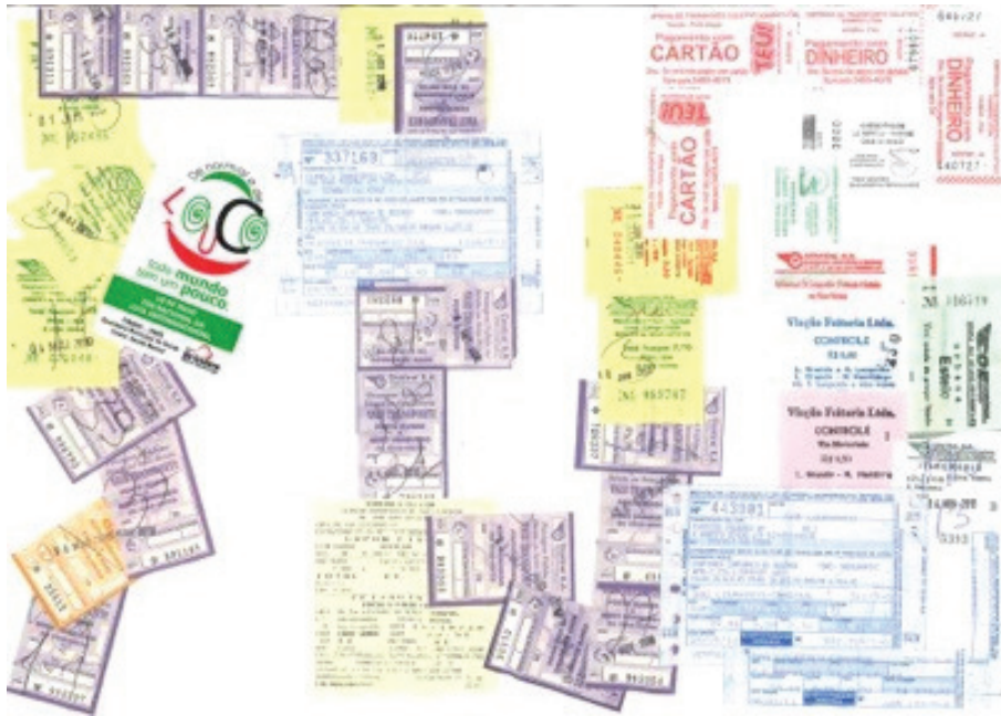
Imagens-mapa 1: Dos percursos