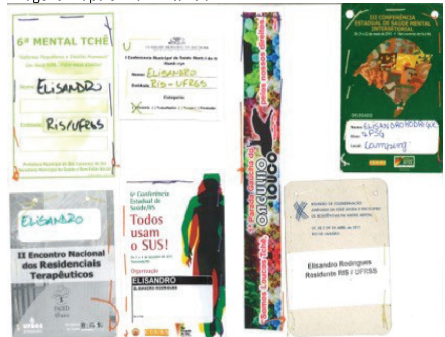
Imagens-mapa 3: Da militância